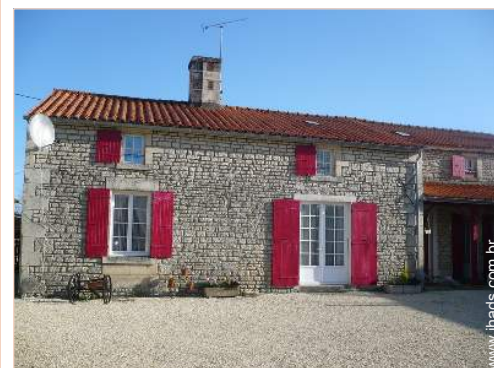
Antiga casa agrícola de Encanto