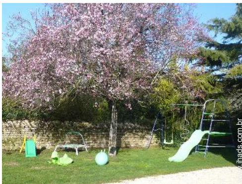
baloço para criança