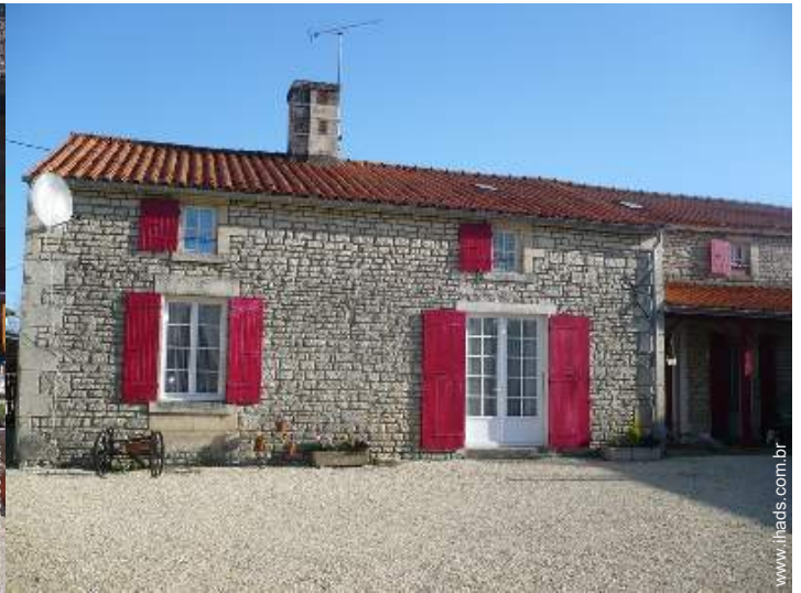
Antiga casa agrícola de Encanto