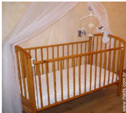
Equipamentos para bebés