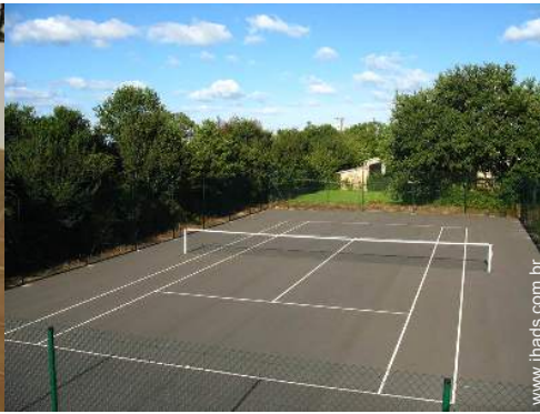
Ténis - superfície dura