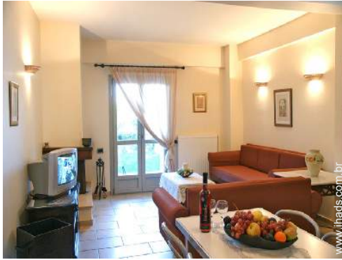
Conforto interior e equipamentos