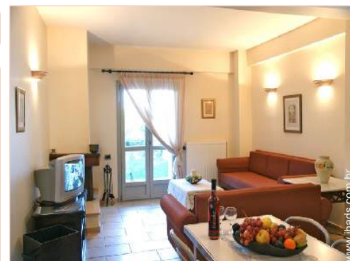
Conforto interior e equipamentos