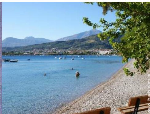
atividades balneares nas proximidades