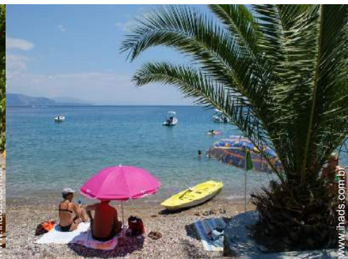
atividades balneares nas proximidades