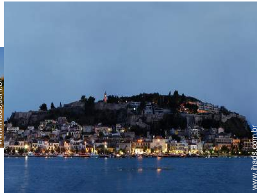
centro da cidade