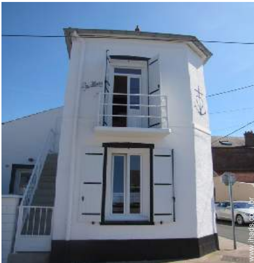
Casa de Encanto