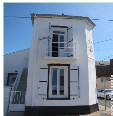
Casa de Encanto