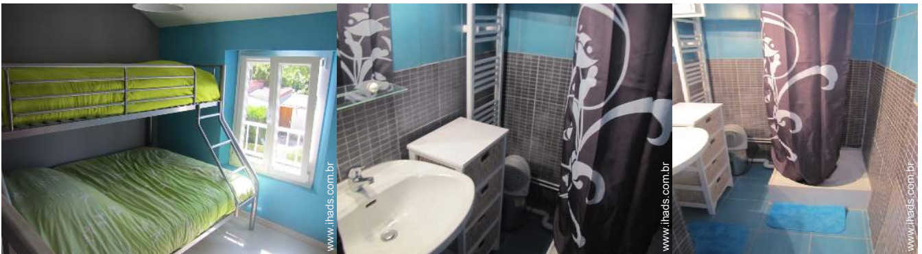
Dormida - cama(s)