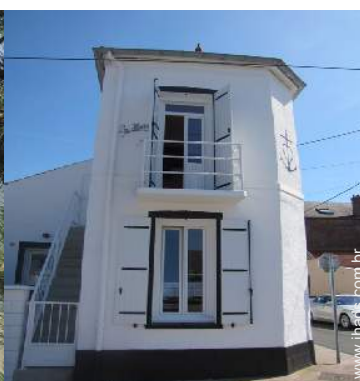
Casa de Encanto