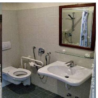
quarto de serviço