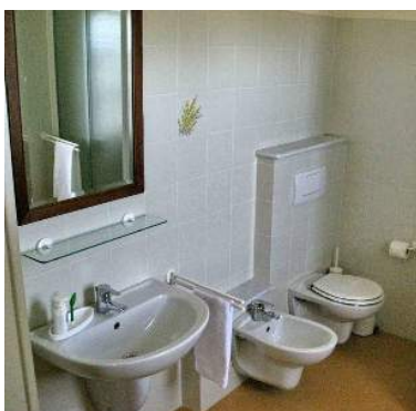
quarto de serviço