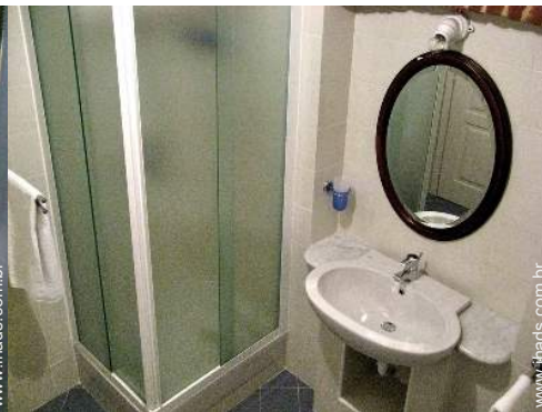
quarto de serviço