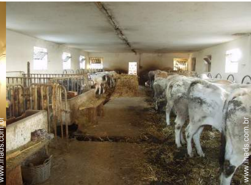
animais da quinta