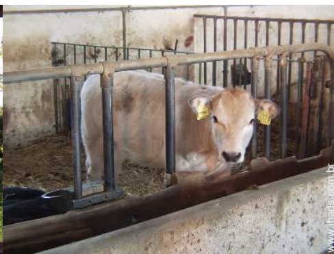
animais da quinta