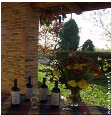
caves e provas de vinho