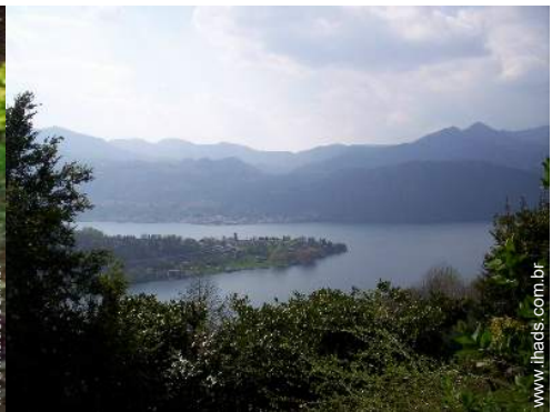
vista para lago