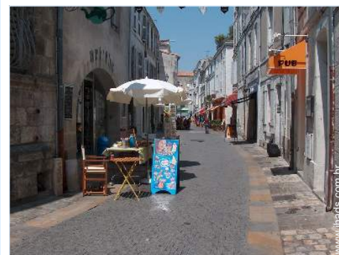
vista rua para peões