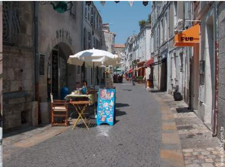
vista rua para peões