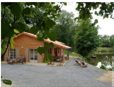
Casa de Encanto em madeira