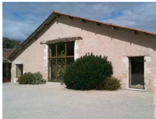
Casa típica de Encanto