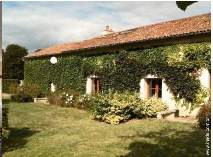
Casa típica de Encanto