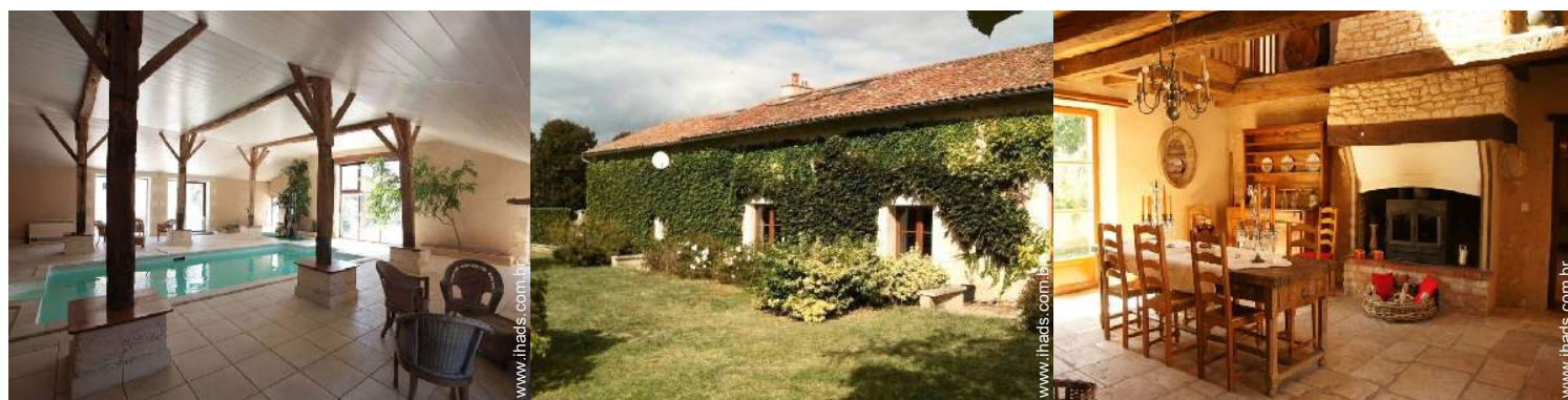
Casa típica de Encanto