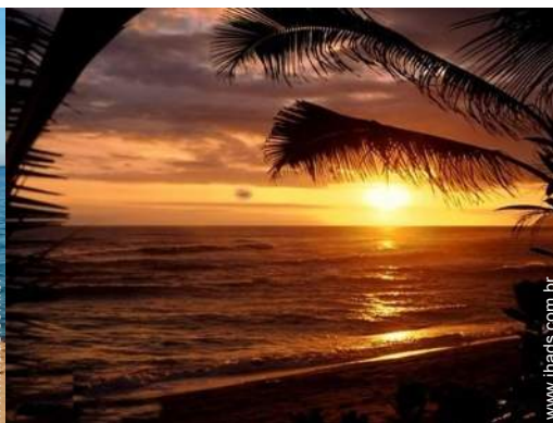
actividades nas proximidades