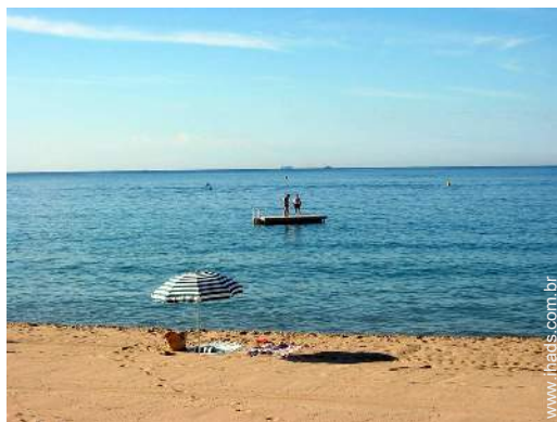
acesso directo à praia