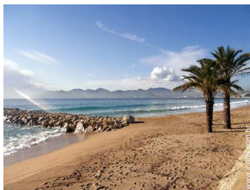
actividades de verão nas proximidades