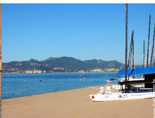
acesso directo à praia