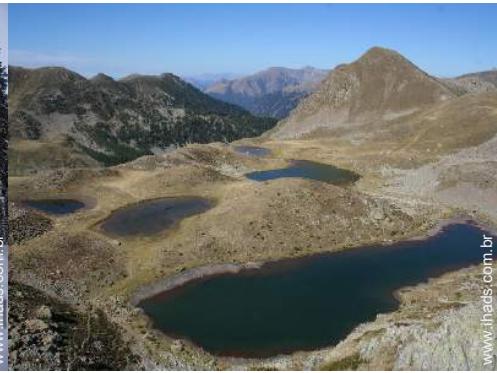
actividades de montanha nas proximidades