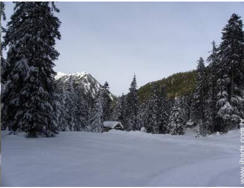
esqui de fundo