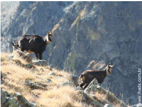
actividades de verão nas proximidades