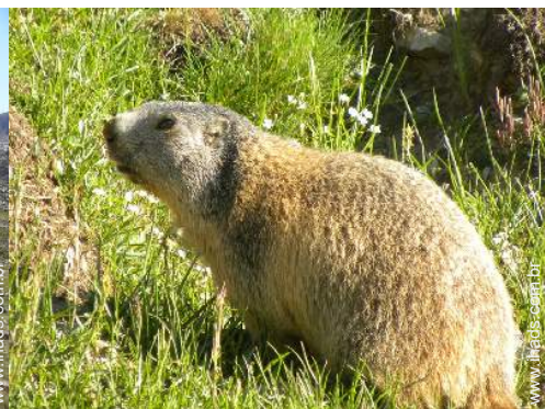
actividades de verão nas proximidades