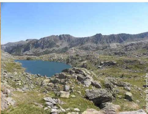
actividades de montanha nas proximidades