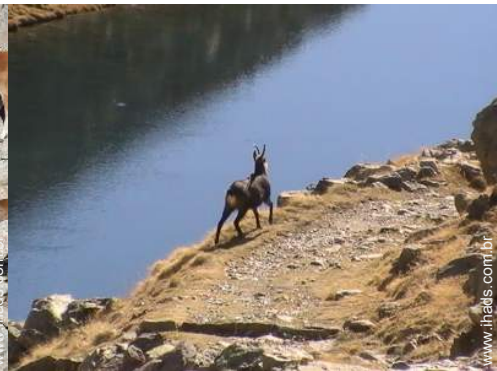
actividades de verão nas proximidades