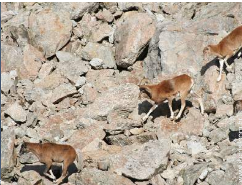
actividades de verão nas proximidades