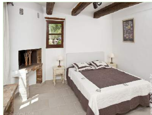
Conforto interior à disposição dos hóspedes