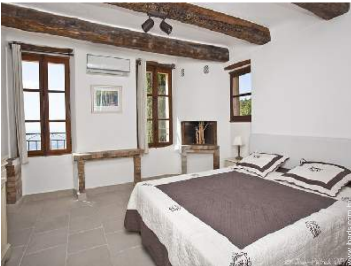
Conforto interior e equipamentos