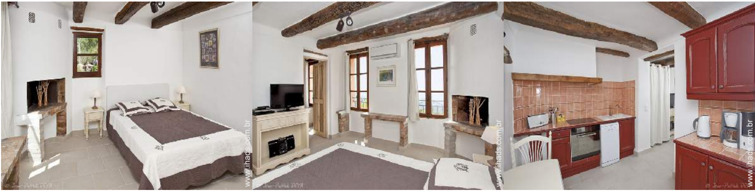
Conforto interior à disposição dos hóspedes