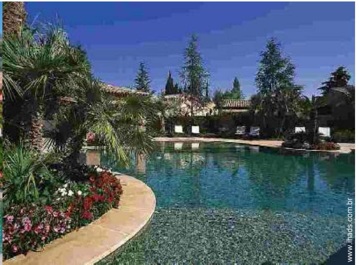
piscina na residência