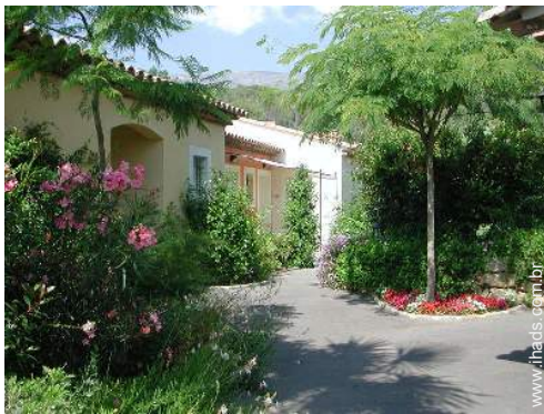
vista da propriedade