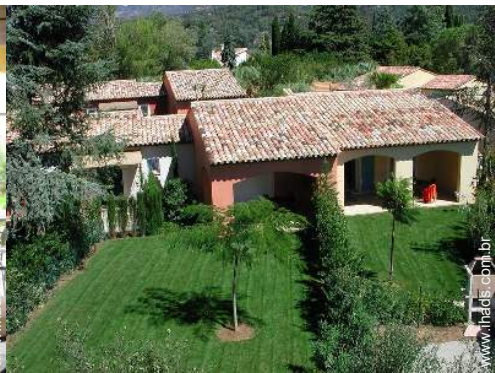
vista da propriedade