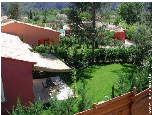
vista da propriedade