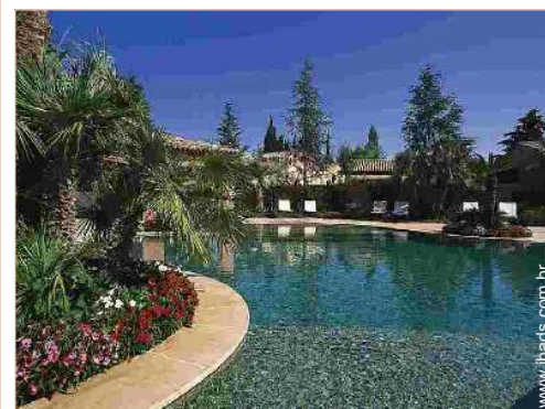
piscina na residência