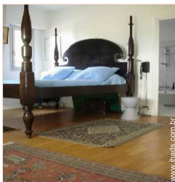
quarto do proprietário