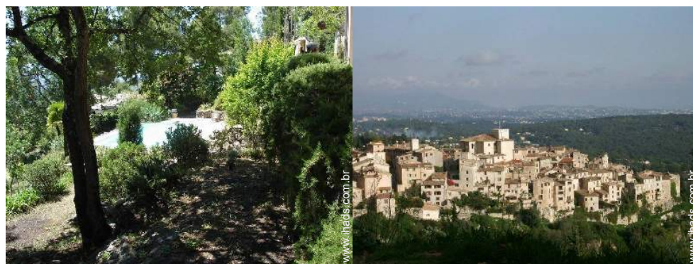
vista de campo