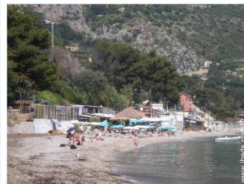
praia de seixos