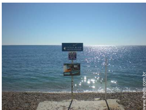
praia de seixos