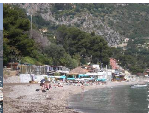
praia de seixos