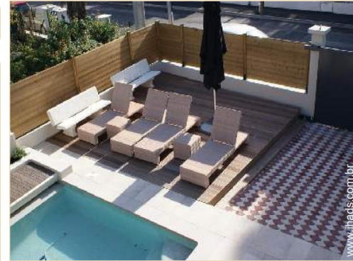
vista a partir do varandim

Cozinha exterior, salão de verão, barbecue a gás, mesa(s) de jardim, cadeira(s) de jardim, carrinho de chá, guarda-sol, espreguiçadeira(s), cadeira(s) de praia, duche exterior, WC exterior