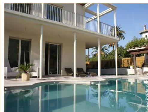
vista sobre piscina