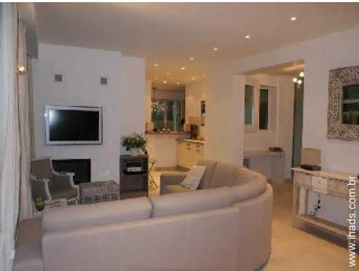
Divisões e comodidades