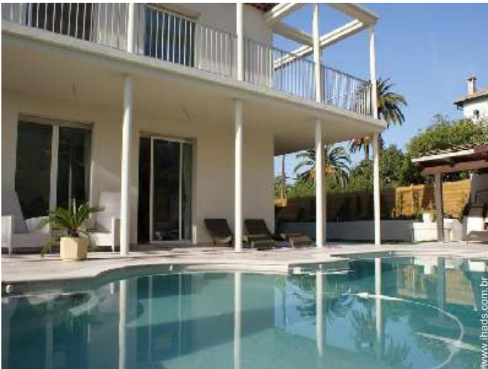
vista sobre piscina