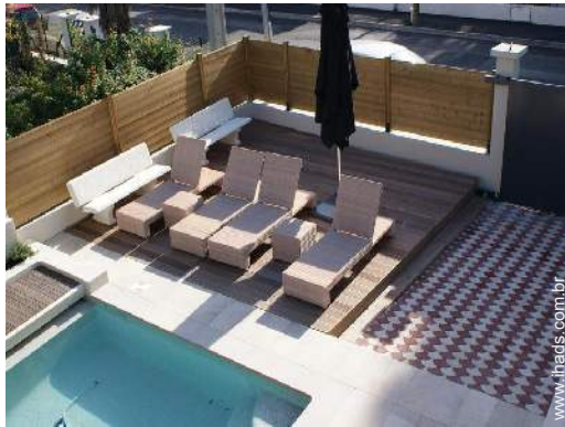
vista a partir do varandim