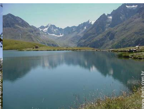
plano de água