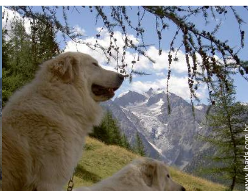
Os animais da casa