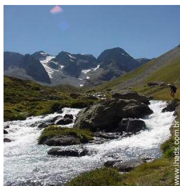
rápidos nos rios