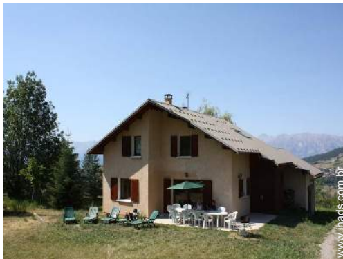
infraestruturas de lazer