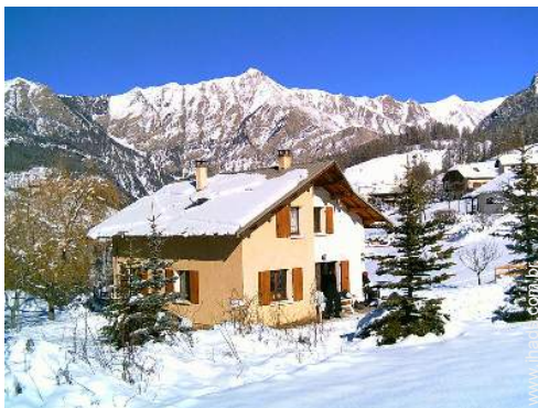
Chalé de Montanha