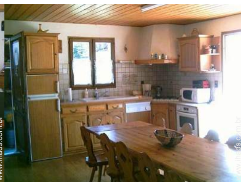
grande cozinha americana