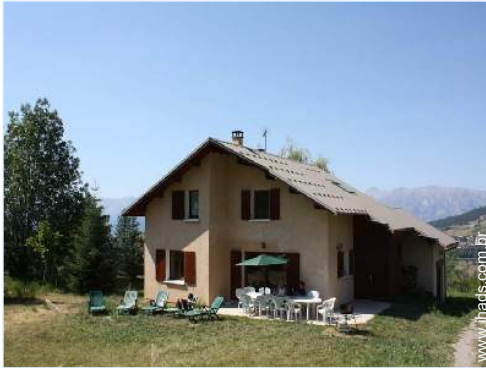
infraestruturas de lazer