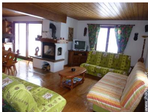
Conforto interior e equipamentos