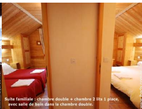
Suite familiale : chambre double + chambre 2 lits 1 place, avec salle de bain dans la chambre double.