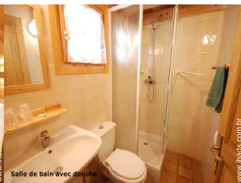
Salle de bain avec douche