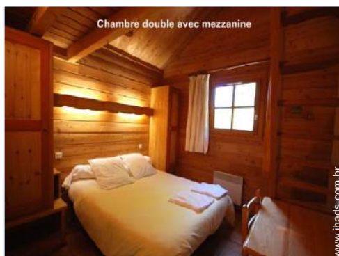
Chambre double avec mezzanine