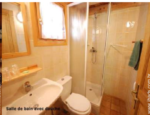
Salle de bain avec douche