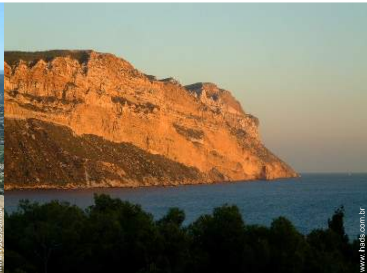
vista a partir do terraço sobre telhado