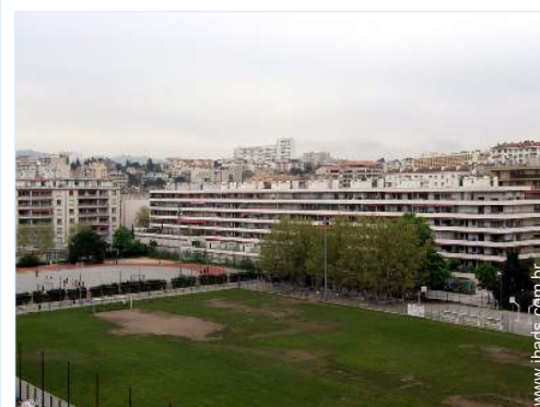
vista a partir do varandim