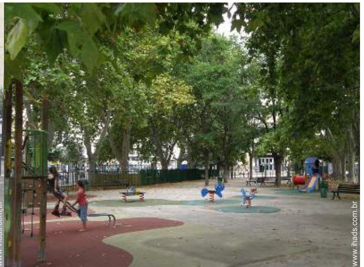
parque e jardim