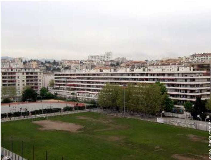
vista a partir do varandim