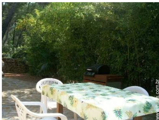
mesa(s) de jardim