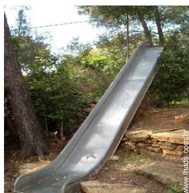
infraestruturas de lazer