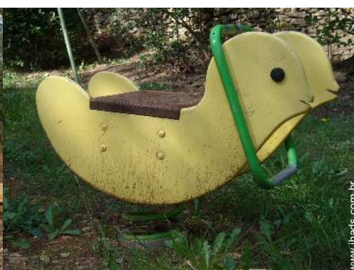
baloço para criança