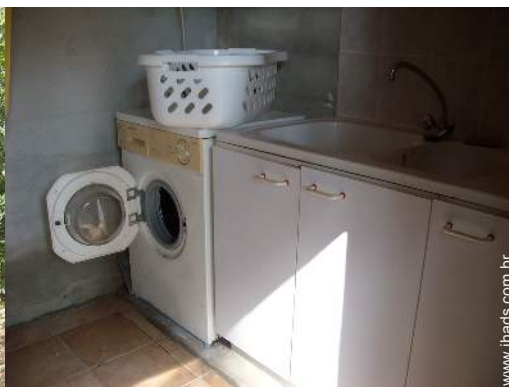
máquina de lavar roupa