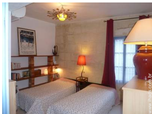
camas separadas simples