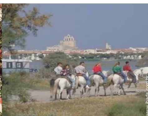
actividades de verão nas proximidades