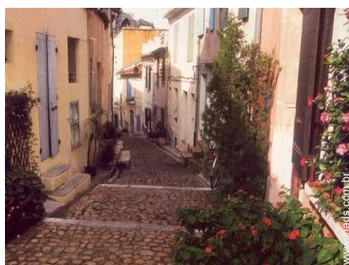
Casa de cidade