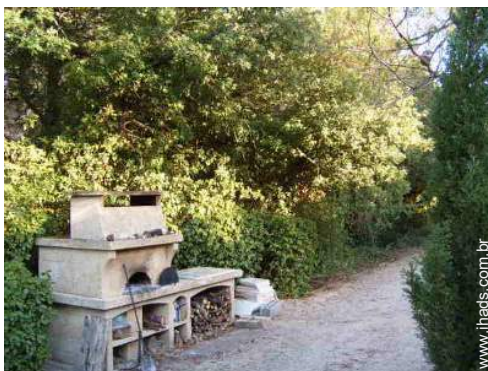
forno para pizza