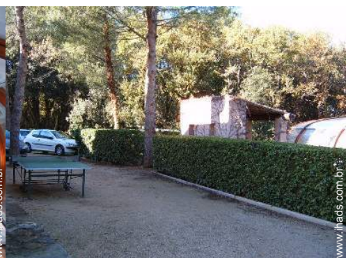
mesa de ping-pong