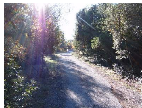
vista a partir do terraço sobre telhado