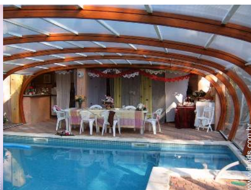
infraestruturas de lazer