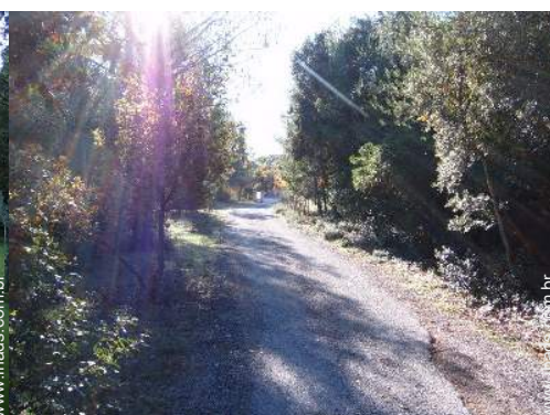
vista a partir do terraço sobre telhado