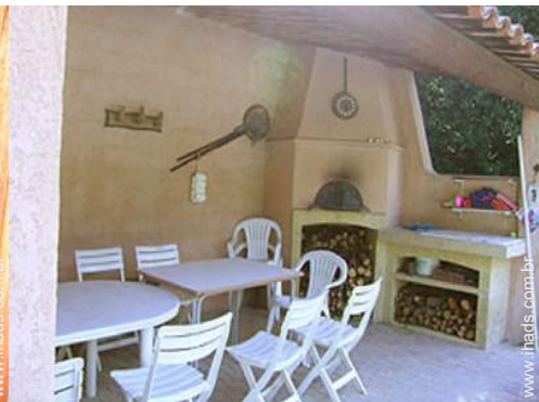
forno para pizza