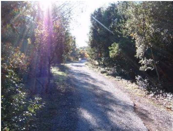
vista a partir do terraço sobre telhado