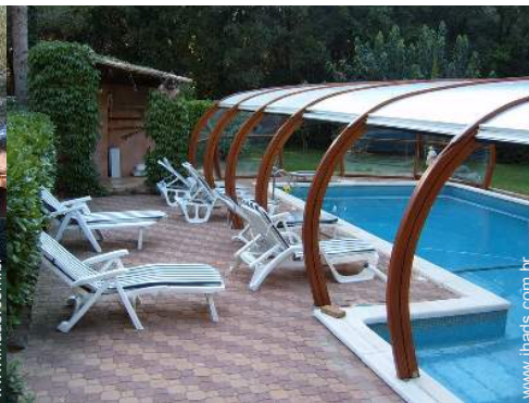
vista sobre piscina