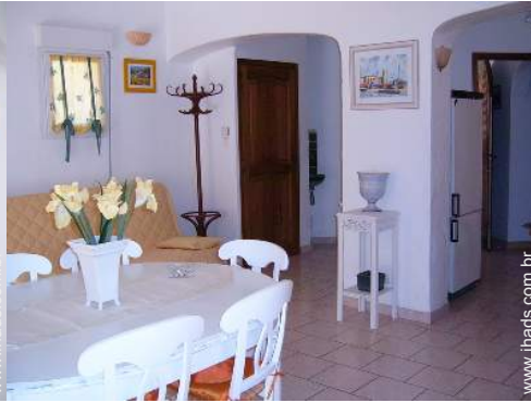
vista a partir da sala de estar