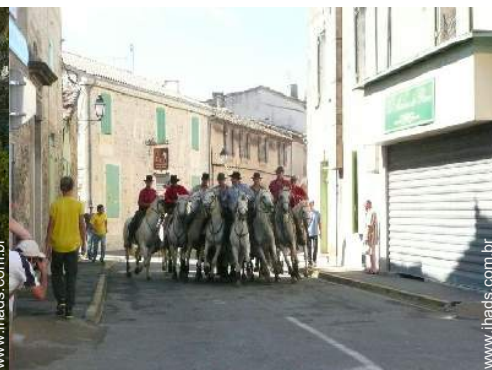
Atrações e lazer