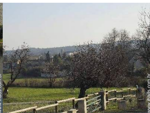
caminho de passeio