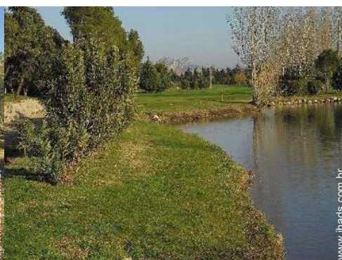
caminho de passeio