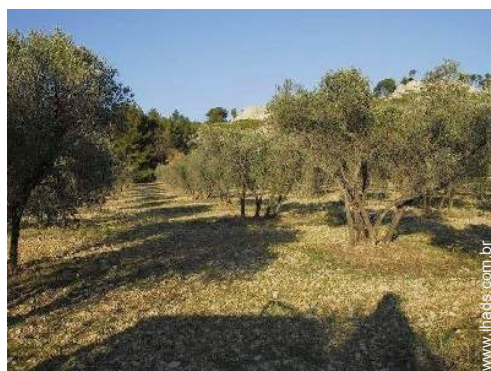
caminho de passeio