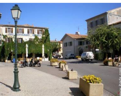
vista centro aldeia