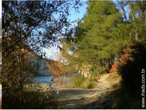
atividades nas proximidades