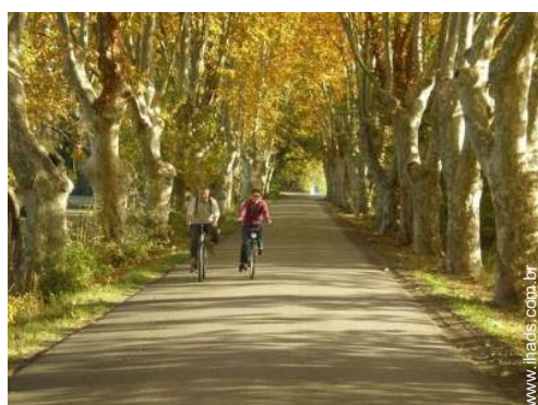
caminho de passeio