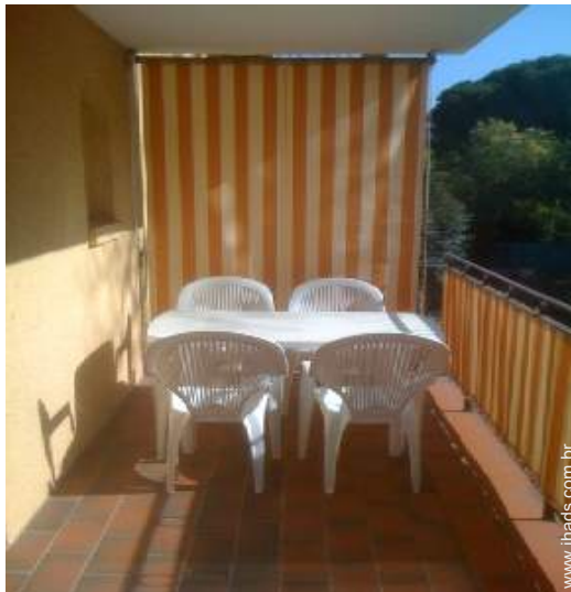
mesa(s) de jardim