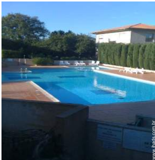
piscina na residência