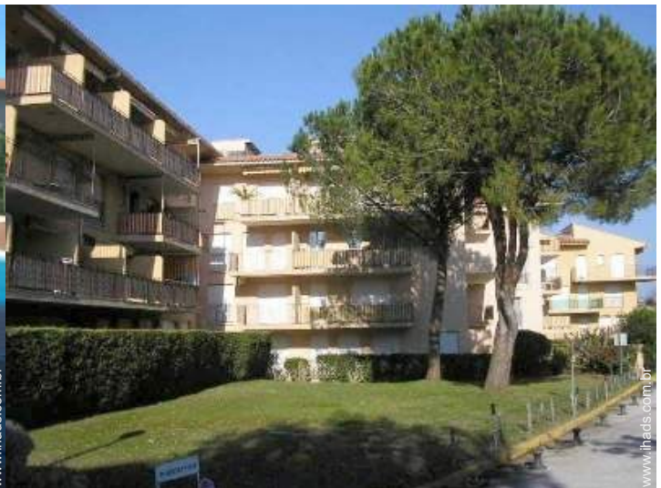
Residência de qualidade