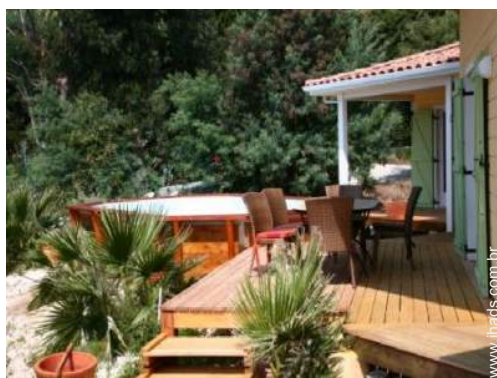
vista a partir da loggia