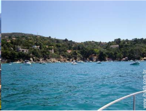
excursão de barco