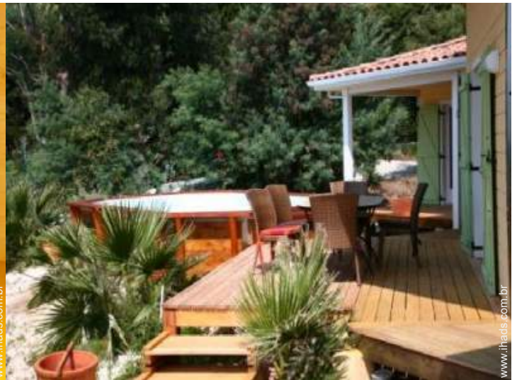
vista a partir da loggia