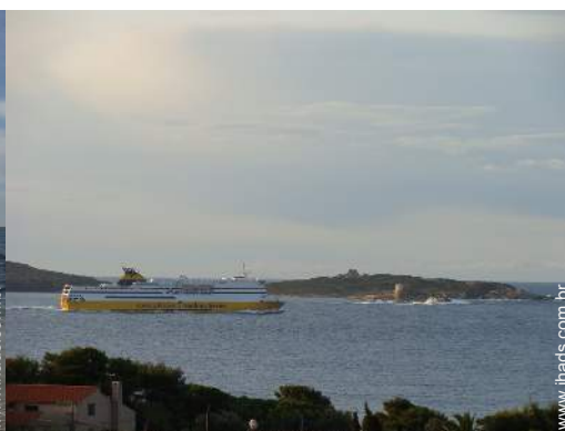
actividades náuticas nas proximidades