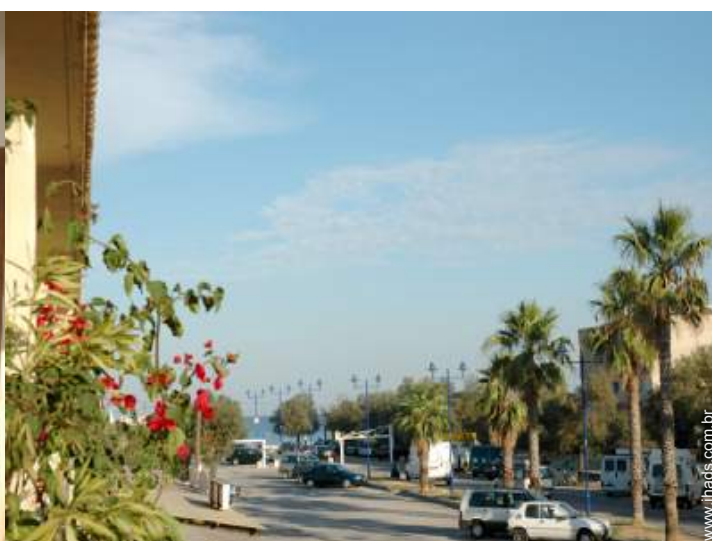
vista a partir do varandim