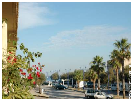
vista a partir do varandim