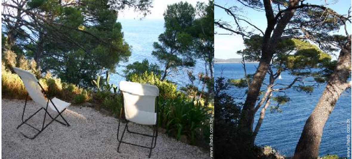
vista sobre o mar