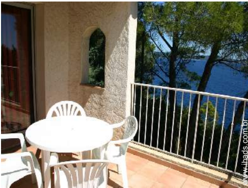
vista a partir do terraço sobre telhado