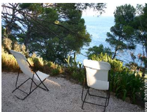
vista sobre o mar