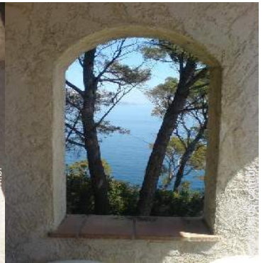
vista a partir do terraço sobre telhado