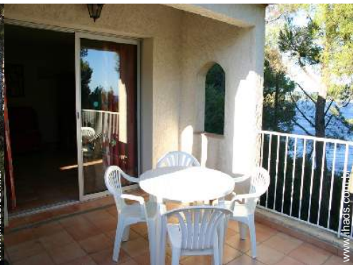
terraço no telhado