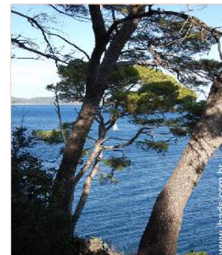
vista sobre o mar