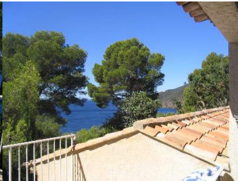
vista a partir do terraço sobre telhado