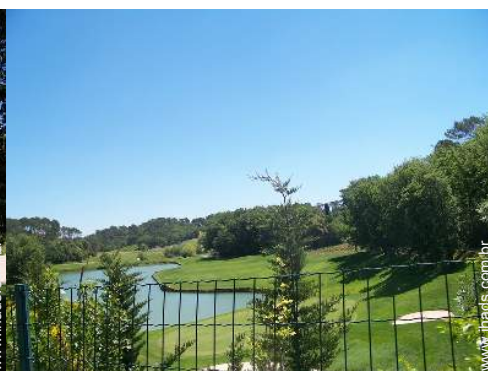
campo de golfe 18 buracos