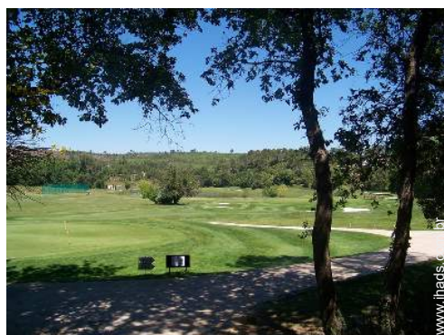
campo de golfe 18 buracos