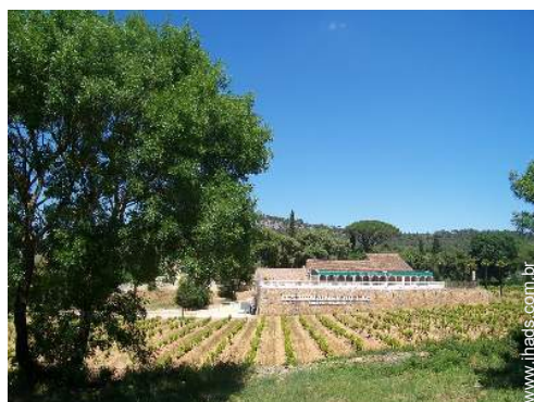
caves e provas de vinho