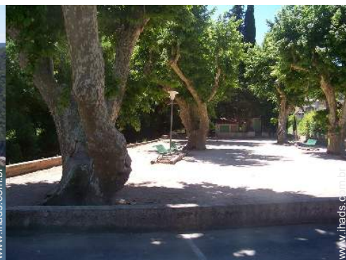
terreno de petanca