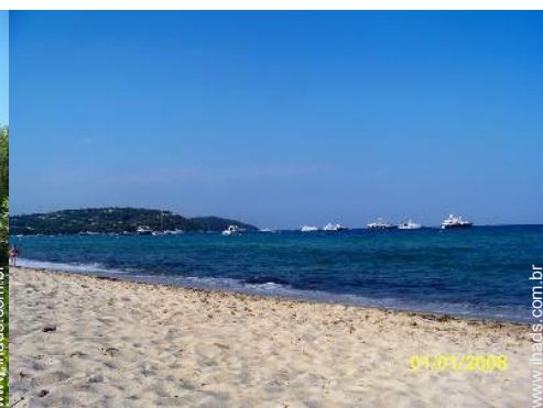
atividades náuticas nas proximidades