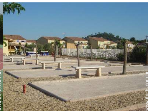
terreno de petanca