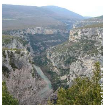
atividades nas proximidades