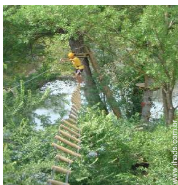
atividades nas proximidades