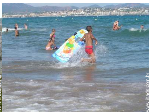
atividades balneares nas proximidades