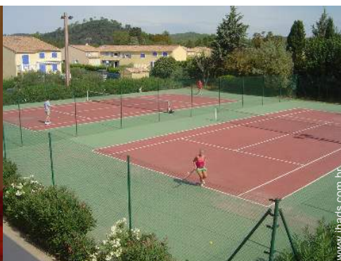
tênis na residência