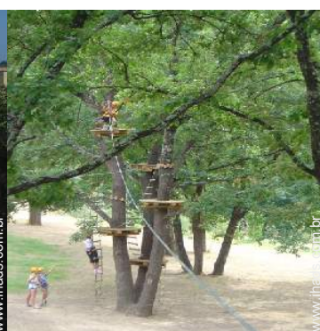
atividades nas proximidades