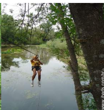
atividades nas proximidades