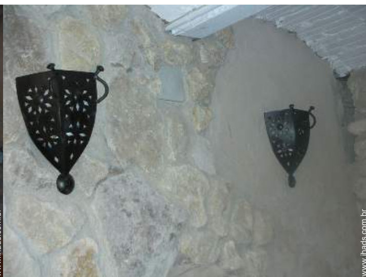
vista de pátio