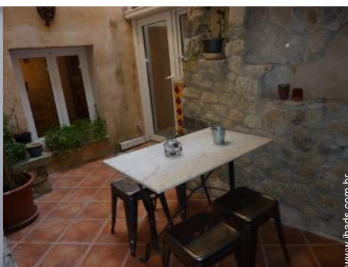
vista de pátio