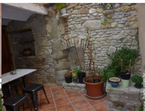
vista de pátio