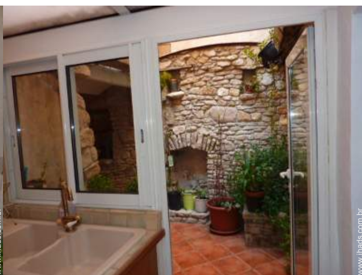
vista a partir da cozinha