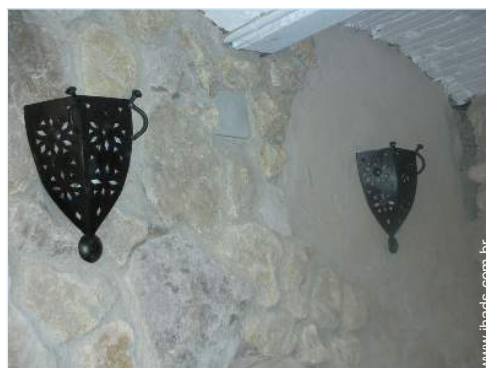
vista de pátio