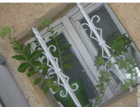
Casa de aldeia