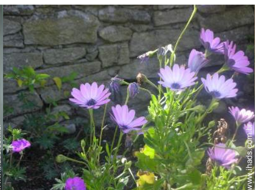
vista de pátio