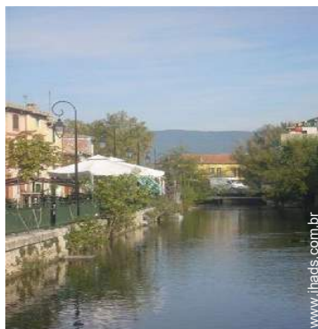
centro da cidade