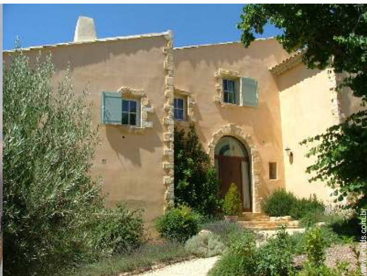
Casa provençal de luxo