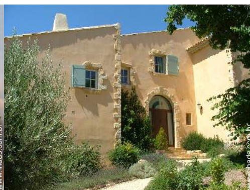
Casa provençal de luxo