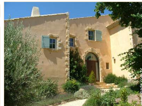
Casa provençal de luxo