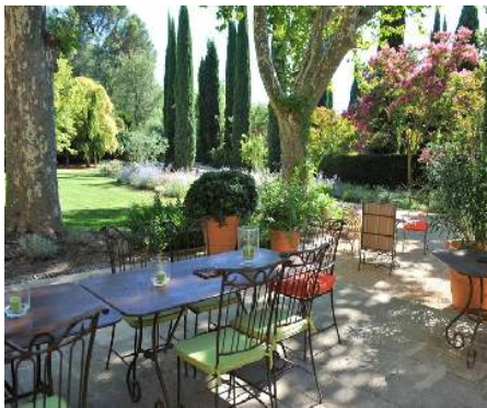
vista de pátio