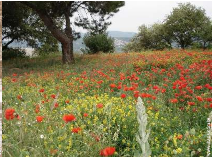
vista de campo