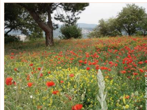
vista de campo