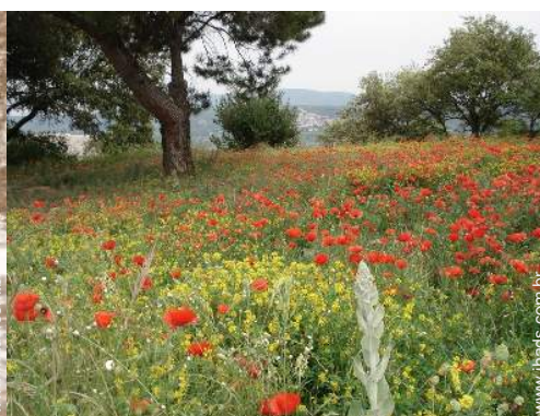
vista de campo