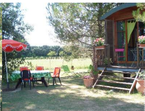
vista de campo