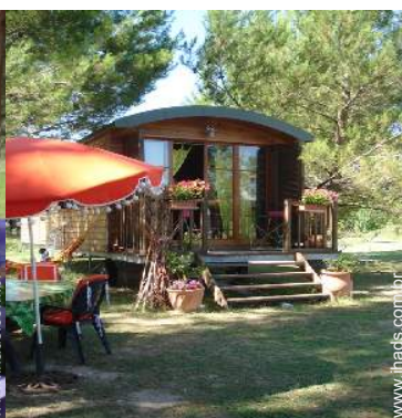
Roulotte de Encanto