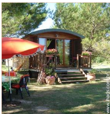
Roulotte de Encanto