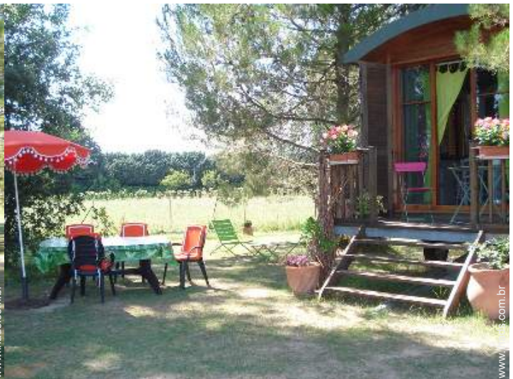
vista de campo