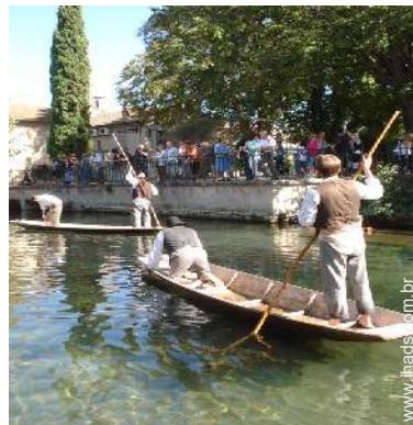
Atrações e lazer