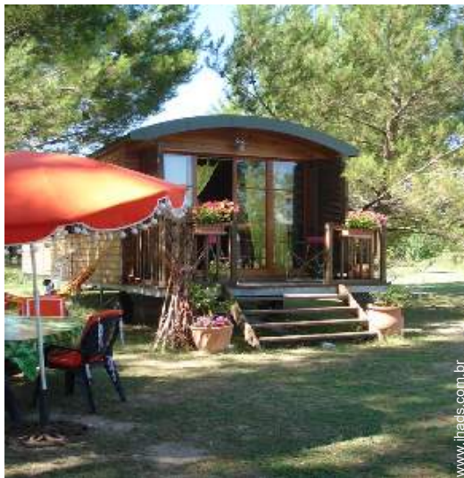
Roulotte de Encanto