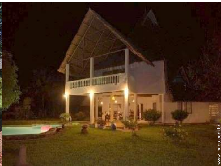
Propriedade de Encanto