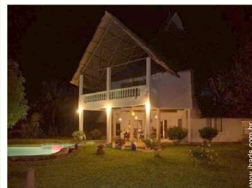
Propriedade de Encanto