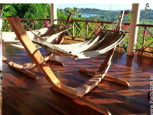
Equipamentos de lazer