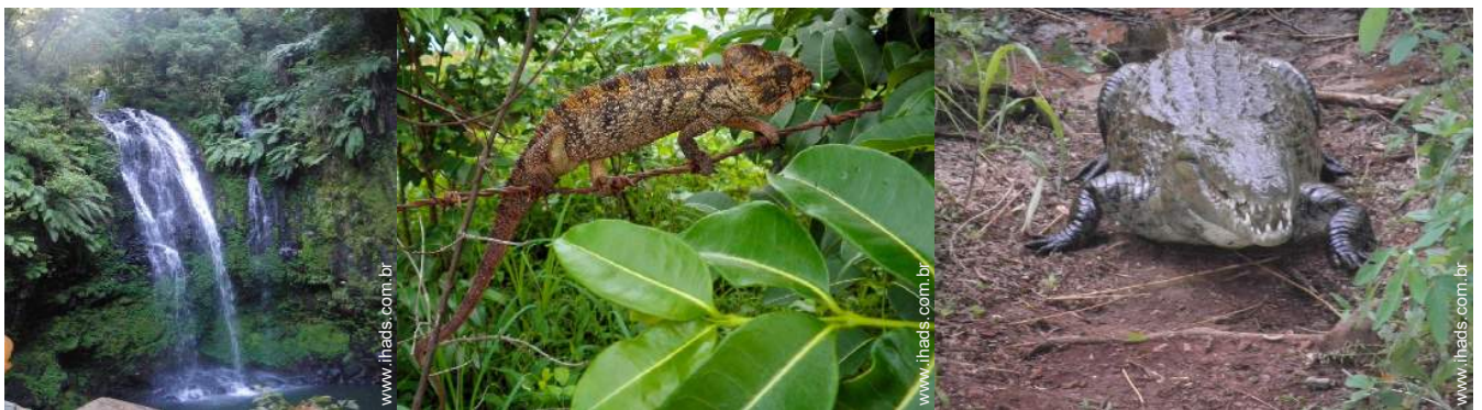
Presença no local