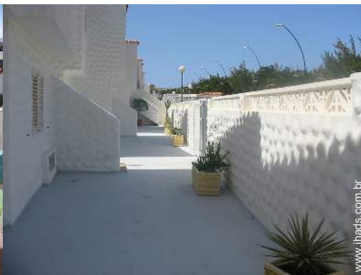
vista a partir da cozinha