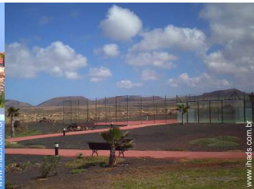
Tênis - pavimento sintético