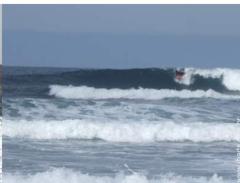
atividades náuticas nas proximidades