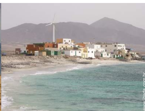
praia de naturismo