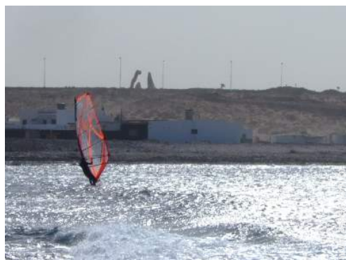
prancha à vela