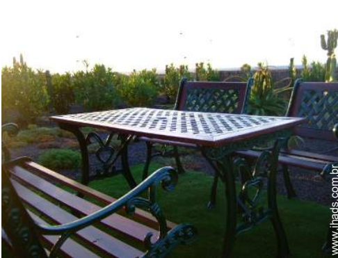
salão de jardim