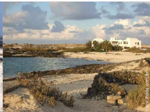
mergulho com tubo