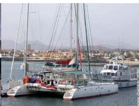
excursão de barco