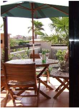
salão de jardim