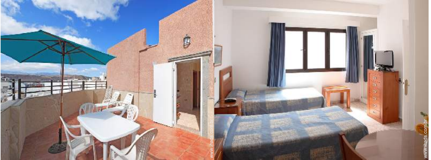
camas separadas simples