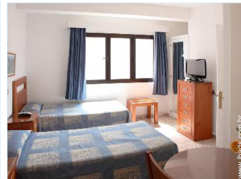
camas separadas simples