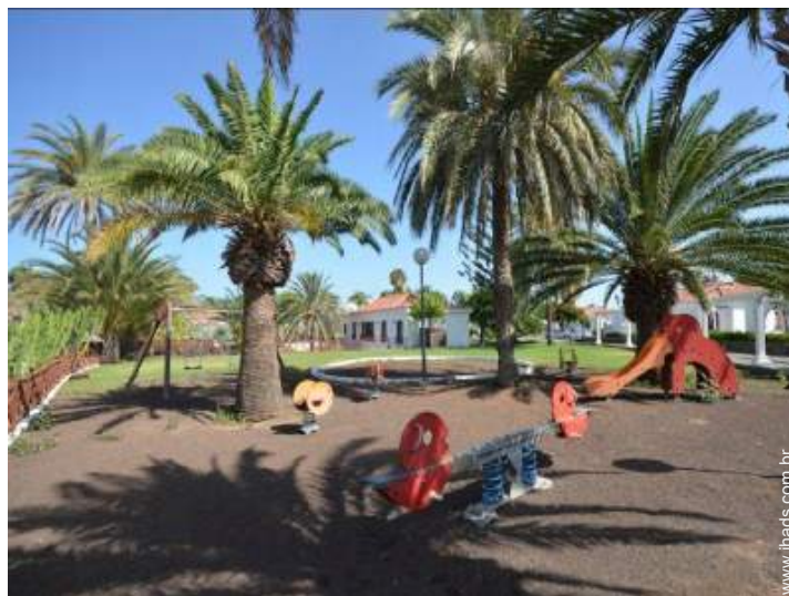
parque infantil com areia