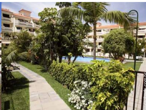
salão de jardim