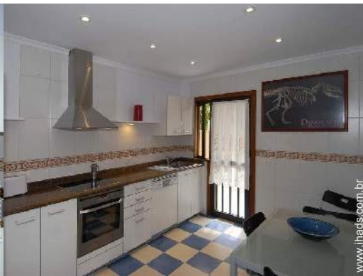
grande cozinha independente