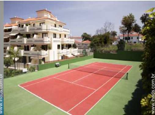
ténis na residência