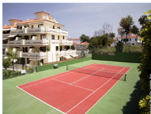
ténis na residência