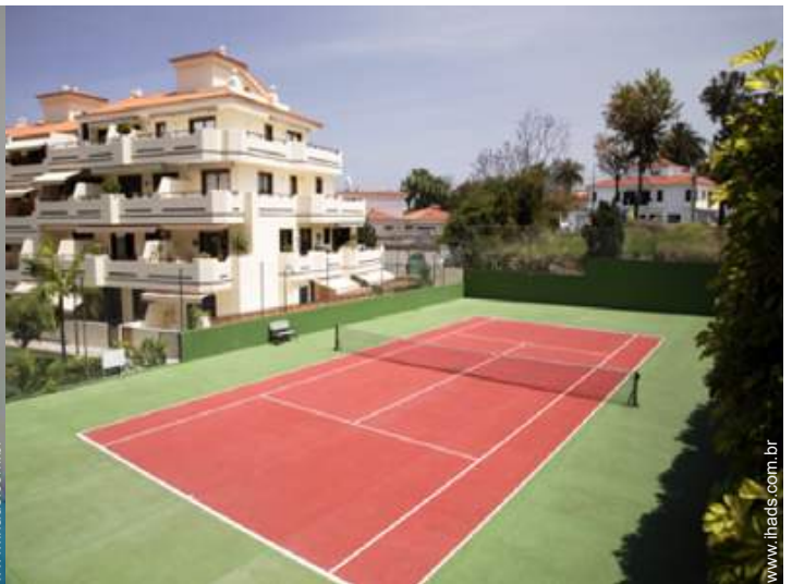
tênis na residência