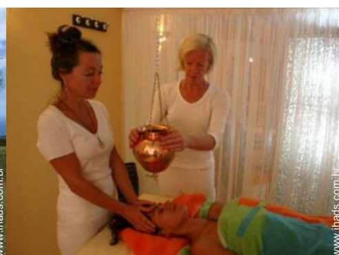
cuidados de beleza