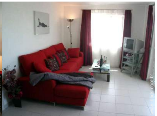
Conforto interior e equipamentos