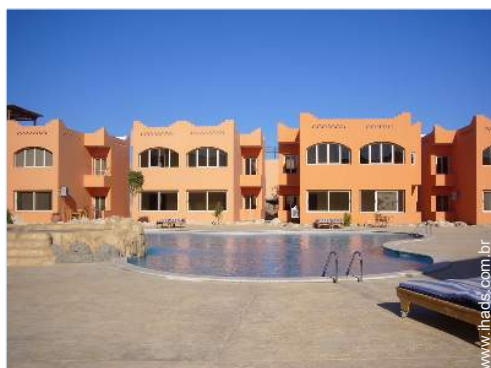
Residência de qualidade