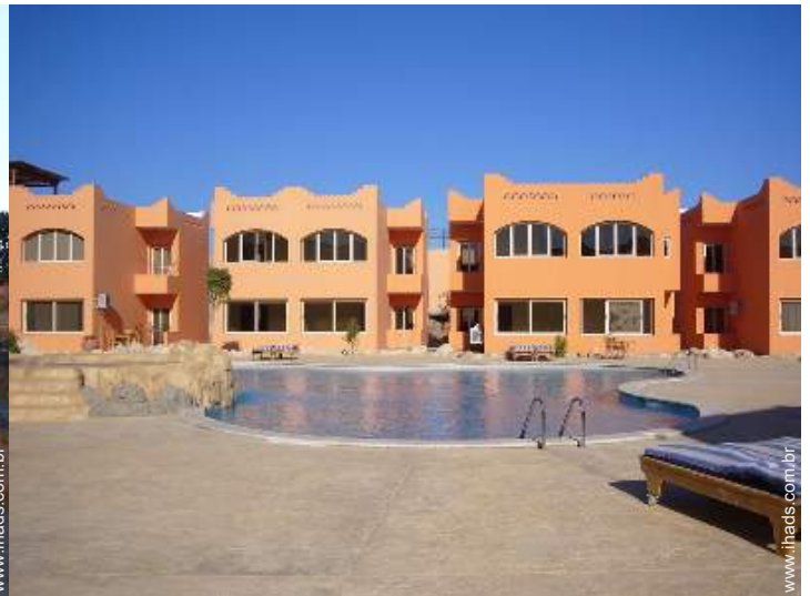
Residência de qualidade