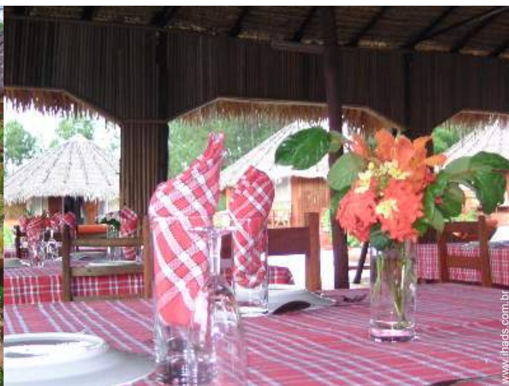
Bungalow de Encanto