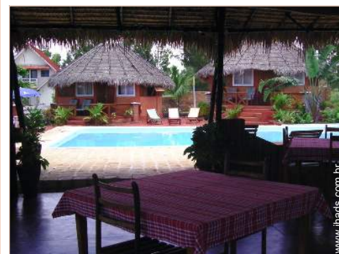
Bungalow de Encanto