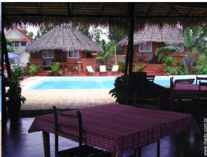
Bungalow de Encanto