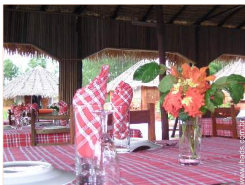
Bungalow de Encanto