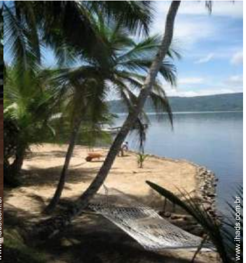
parque infantil com areia