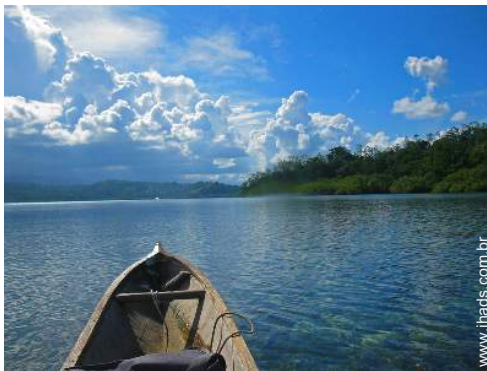
barco a remos