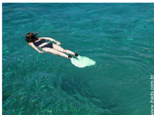
mergulho com tubo