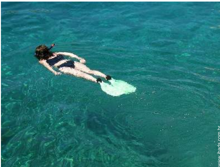
mergulho com tubo