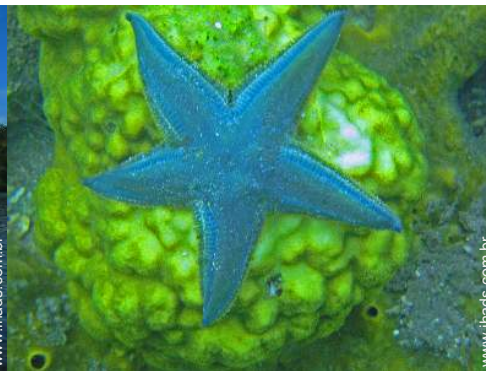
mergulho com tubo