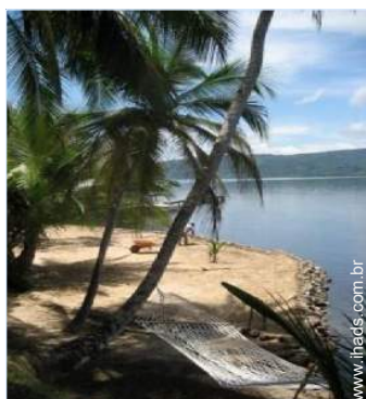
parque infantil com areia

Acesso directo à praia, praia privada, pontão privado, lugar para barco no porto