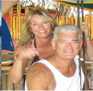
Os seus hóspedes